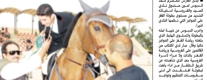
الدبوس يشكو من تراجع فروسية القفز

وحدث من تفاق الأوضاع العالمية لان ذلك سيؤدي الى مزيد من التدهور ورفقان الثقة كليا بجده الرياضة حيث سيسحب عندها الجياد اي حلول اول من اجل وقف هذا التدهور على الاقل.