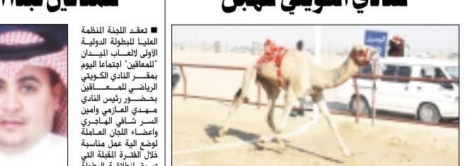
سباقات الهجن تصل للدرجة الـ 25