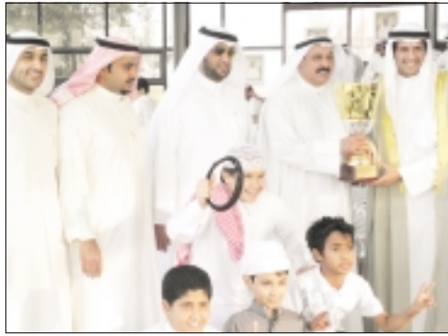
عميد اسطيل الثويران يتسلم كأس الدعيح

تمكن الجواد القوي "طراح الخير" لاسطيل خالد العميدي بالخيال "مبون" من الفوز بكأس الشيخ ابراهيم الدعيح الصباح محافظ الاممدي وذلك بعد منافسة ساخنة مع اطيح جيهاد الدرجة الثالثة على مسافة 1400 متر.