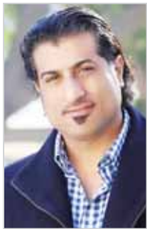
■ جمال الفيلان

■ يشارك الفيلم البحريني القصير "المسافة" سيناريو وأخراج جمال الفيلان في مهرجان "القمره السينمائي"، الذي سيفقد في الخامس عشر من شهر أبريل المقبل في العراق "البصرة". الفيلم من بطولة سارة الحسن وياهو برون وتم تصويره في الهند. وتدور أحداثه حول الطفلة، حيث لا يوجد إنسان يعيش بلا طفلة، لكن الشجاعة هي بالقمره على الاعتدال لمن انطألت بعقده، مهما كانت الظروف ومهما طال الزمن وبعد المكان. من جانب آخر تم اختيار المخرج الفيلان في لجنة تحكيم مهرجان "الاصفاء" للأفلام الاجتماعية القصيرة، الذي سيقام في الفترة بين 12 و14 أبريل، كما تضم اللجنة كلا من أحمد الماء والمخرجة هاجر النعيم، وستقام على هامش هذا المهرجان ورش عمل وجلسات نقاش وندوات متخصصة في شتى المواضيع السينمائية، حيث سيقدم الفنان البحريني خالد الرويحي ورشة عن مهارات التمثيل، وسيقدم المخرج محمد الفرج ورشة عن صناعة الفيلم الوثائقي، ويهدف مهرجان الاصفاء إلى دعم الإنتاج في مجال صناعة الأفلام وتشجيع الشباب على تنمية مواهبهم وتوفير منصة عرض عالية الأيكالات والتجهيزات ويعتبر منبرا للتعبير، ويسعى كذلك إلى تقديم الشباب إنتاج أعمال فنية تخدم المجتمع والوطن.