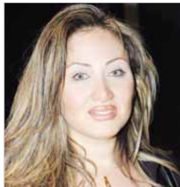
■ ريهام سعيد

■ قضت محكمة مصرية ببراءة الإعلامية ريهام سعيد من تهمة "التحريض على اختطاف طفلين"، وفق مصدر قضائي. وقال المصدر لوكالة "أنباء الشرق الأوسط"، أن محكمة جنحيات الجيزة قضت بحضوريا ببراءة الإعلامية ريهام سعيد وثلاثة آخرين من فريق برنامج "صبايا الخير" الذي تقدمه على قناة فضائية "خاصة". فيما قضت المحكمة بحضوريا بمعاقبة غرام عيسى، معدة في البرنامج، بالحبس سنة وأياماً المعقوبة لمدة ثلاث سنوات "عقوبة امترازية" ومعاقبة متهمين اثنين "ماملين متهمين باختطاف طفلين" بالسجن 15 عاماً، وفق المصدر ذاته. ويعد للحكم أولياً، أي قابل للطعن من جانب النيابة العامة أمام محكمة النقض خلال 60 يوماً من صدور حيايات الحكم للمحاصلين على البراءة، لكن ذلك لن يوقف الإفراج عنهم. أما المحاصلون على أحكام بالإدانة فيتم تقديم طعون