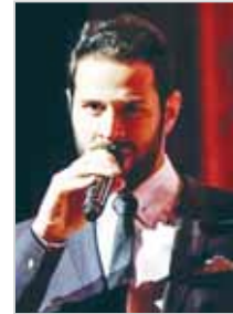
■ عمر كمال

الدولية ومع كوكبة من أهم المودين حول العالم. يتضمن البرنامج الرئيسي حفلات مهرجان "ابوظبي" الذي يستمر حتى 31 مارس الجاري، عدداً من العروض الرائعة الأخرى، من بينها حفل بعنوان "نحن الأحياء" رقص كلاسيكي من الهند" تقدمه أكاديمية تانسري شنكر للرقص، بقيادة مصممة الرقص تانسري شنكر التي تعد من أبرز الشخصيات المساهمة في تشكيل فن الرقص الهندي المعاصر، وحفل لفرقة "جينكس ماريتيمي" المعروفة بـ"الأوركسترا المصغرة"، وحفل "بيانوغرافيك" أعمال على التي بيانو لغيليب غلاس، ستيف راينج وموريس رالف مع عروض بصريّة حية، أما عشاق الموسيقى الهندية الكلاسيكية فموجودهم مع حفل "سيد السارود، أمجد علي خان"، الذي سيطرب الجمهور بموسيقاه الساحرة على آلة السارود، التي تعتبر عنصر أساسياً في تقاليد الموسيقى الهندية، وسلسلة حفلات المهرجان المنفرد، مشروع باخ، والختام مع حفل للفرقة الوطنية الإسيانية للرقص التي ستقدم عروضاً باليه مميزة تحت عنوان "دون كيشوت" للمرة الأولى في العالم العربي.