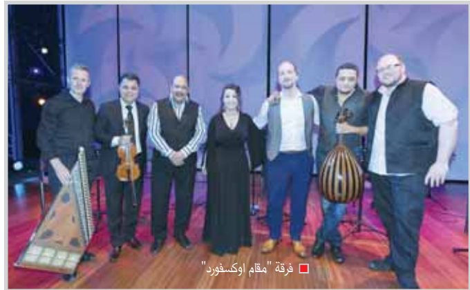
■ فرقة "مقام أوكسفورد"