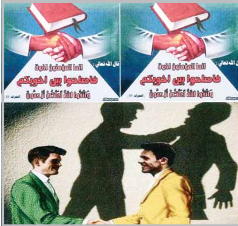
الإصلاح بين الناس عقيدة إسلامية

أَفْتَقَدُوا فَأَصْلِحُوا بَيْنَهُمَا (المجادل:9)