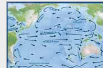
يصرق الله الرياح كيف يشاء فيغير الطقس كل لحظة "سبحان الله"