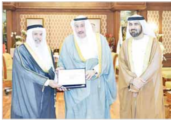
محافظ الفروانية الشيخ فيصل الحمود خلال تكريمه سفير البحرين الشيخ خليفة بن حمد بحضور سفير الإمارات رحمة الزعابي

استقبل محافظ الفروانية الشيخ فيصل الحمود بمكتبه، سفير مملكة البحرين لدى الكويت الشيخ خليفة بن حمد آل خليفة، بمناسبة انتهاء مهام عمله، بحضور سفير الإمارات العربية الشقيقة رحمة الزعابي. وتبادل المحافظ والسفير البحريني التحيات حول العلاقات الثنائية وسبل تعزيزها في مختلف المجالات، مؤكداً عمق العلاقات الكويتية - البحرينية، حيث صاغتا عبر تاريخهما المشترك نموذجاً متقدماً في العلاقات المتميزة بروابط الأخوة والمحبة الصادقة، حتى باتا "قلبين في