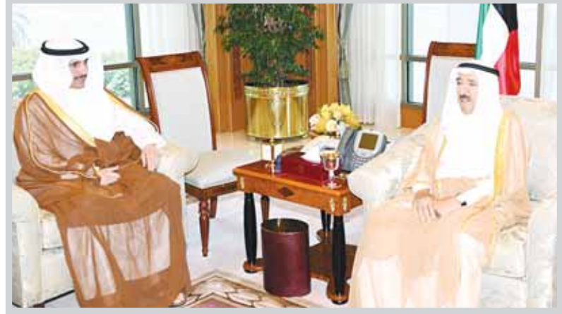
سمو أمير البلاد الشيخ صباح الأحمد لدى استقباله رئيس مجلس الأمة مرزوق الغانم