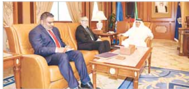
وزير الداخلية الشيخ خالد الجراح لدى استقباله السفير الأميركي لورانس سيلفرمان

الصديقين. ونقل البيان عن الشيخ خالد الجراح تكديده على عمق العلاقات بين البلدين الصديقين وتوافق الروى حول القضايا الإقليمية والدولية. من جهته أشاد السفير الأميركي بحسب البيان بدور الكويت في إلال السلام في المنطقة، ثمناً مساهمات التقاطع والتعاون بين الكويت والولايات المتحدة الأميركية.