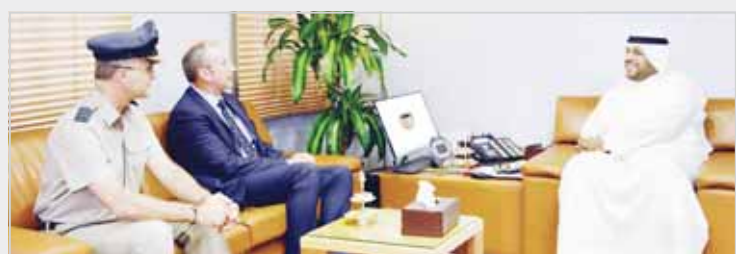
وكيل وزارة الدفاع الشيخ أحمد منصور مستقبلاً السفير البريطاني مايكل دانفورت

استقبل وكيل وزارة الدفاع الشيخ أحمد منصور الأمجد بمكتبه صباح أمس سفير المملكة المتحدة لدى البلاد مايكل دانفورت، يرافقه الملحق العسكري البريطاني لدى البلاد المقيد طيار فينلي ملكين. وتم خلال اللقاء مناقشة أهم الأمور ضمن محور الزيارة، مشيداً بموقف العلاقات الثنائية بين البلدين الصديقين والمرص على تعزيزها وتطويرها.