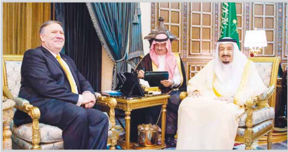
خادم الحرمين الشريفين الملك سلمان بن عبدالعزيز مستقبلاً وزير الخارجية الأمريكي مايك بومبيو في الرياض

وأوضحت الصحيفة الأميركية أنه "بينما تحرس السعودية حفر خندق على طول حدودها مع قطر، والقاء نقليات نووية بالقرب منها، وصل وزير الخارجية مايك بومبيو إلى الرياض، في أول رحلة خارجية له، حاملاً رسالة بسيطة، كفي". وأضافت أن بومبيو أبلغ الجبير، أن "الخلاف (الخليجي) يجب أن ينتهي"، وذلك وفقاً لمسؤول رفيع المستوى في وزارة الخارجية. على صعيد آخر، أعلنت السعودية عن وصول وحدات من قواتها إلى إزمير غرب تركيا، للمشاركة في تمرين "EFES 2018" والمقرر في مايو المقبل، فيما أكد رئيس مجلس علماء باكستان الشيخ طاهر محمود الأخرفي من السعودية السنيدي في إدارة الحرمين الشريفين، مضيفاً "تقف مع أئمة الحرمين الشريفين ضد كل من يطاول تسييس الحج".