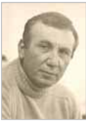
الشاعر السوري الراحل نزار قباني

عام 1854: إنشاء أول خط سكة حديد في البرازيل. عام 1909: تم افتتاح المعهد الصناعي الفيدرالي للنساء وهو أول سجن فيدرالي للنساء في الديرسون بولاية وست فيروينيا. يقضين عقوبة فيدرالية تزيد عن عام تم إحضارهن إلى هذا السجن. عام 1981: افتتح الأمير السعودي الأمير متعب بن عبد العزيز مبنى مقر منظمة العواصم والمدن الإسلامية بمكة المكرمة. عام 1984: تم افتتاح المحجر الدولي الاول لتنمية أسواق رأس المال في الكويت و دول مجلس التعاون الخليجي. عام 1998: وفاة نزار قباني الشاعر السوري الذي اشتهر بأعماله الرومانسية والسياسية الجريئة. تميزت قصائده بلغة سهلة ووجدت بسرعة ملايين القراء في أنحاء العالم العربي. عام 1999: لقي ثلاثة أشخاص مصرعهم وأصيب ثلاثون شخصاً على الأقل من جراء ثالث انفجار يحدث في العاصمة البريطانية لندن في غضون ثلاثة أسابيع، وقد حدث الانفجار في حانة الأدميرال دونكان في هي سوو حيث كان المكان مكتظاً بالرواد في عطلة نهاية الأسبوع. عام 1999: أصبحت دولة الكويت مصنفة اولى على مستوى العالم في مسابقات المصارعة للمقاتلين في لعبة سلاح سيف المصارعة. عام 2003: الاتحاد الدولي وجمعيات الصليب الأحمر تحقار دولة الكويت لتكون مقراً إقليمياً للاتحاد الدائم لمنطقة الخليج العربية. عام 2004: اندونيسيا تعادو لإلقاء القبض على الداعية الإسلامية أبو بكر باعشير بعد 18 شهراً قضاه في السجن نتيجة ضلوعه في تفجيرات بالي. مناسبات اليوم : يوم الملكة في هولندا - بداية الربيع في اسكتلندا - عيد الطفولة في المكسيك.