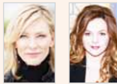
أمير تاملين ■ كايت بلانشيت